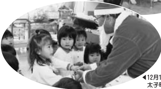
▲12月17日(木) 太子町立幼稚園