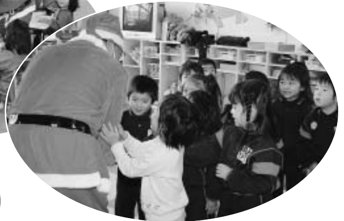
▲12月17日(木) 松の木保育園