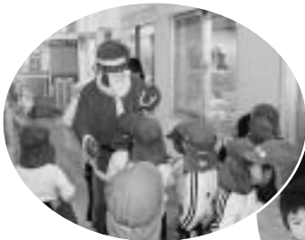
▲12月9日(水) やわらぎ保育園・幼稚園▶